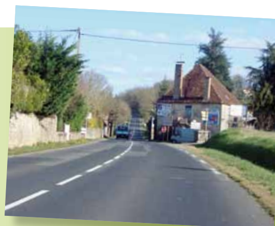
Opération de Vayrac à Saint-Michel-de-Bannières

Des travaux de déboisement à Blanat et Labrousse seront réalisés à l'automne 2014, en préparation d'une deuxième section de travaux.