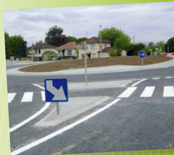
Aménagement du giratoire de Carlat

La lettre d'information sur la Voie d'avenir continuera d'être publiée et diffusée au fil des avancées importantes du projet.